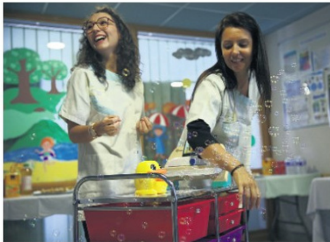
Le bobomobile, un chariot qui permet de distraire les enfants en les emmenant dans un monde imaginaire.

Et ont souhaité monter leur propre projet : concevoir un chariot que le binôme infirmière-aide puéricultrice pousse pendant les soins, garni de tout un tas de matériel adapté aux différents âges, pour entraîner les enfants dans un rêve. « Dans chaque tiroir, il y a un ensemble de jeux qui jouent sur l'olfactif, le visuel, la kinésie. La machine à bulles marche très bien pour les petits, pour les plus grands il y a un masque à réalité virtuelle qui les emmène nager avec les dauphins ou les grandes tortues... » Les soignants sont unanimes : le matériel est nécessaire mais ne se suffit pas à lui seul. « Il